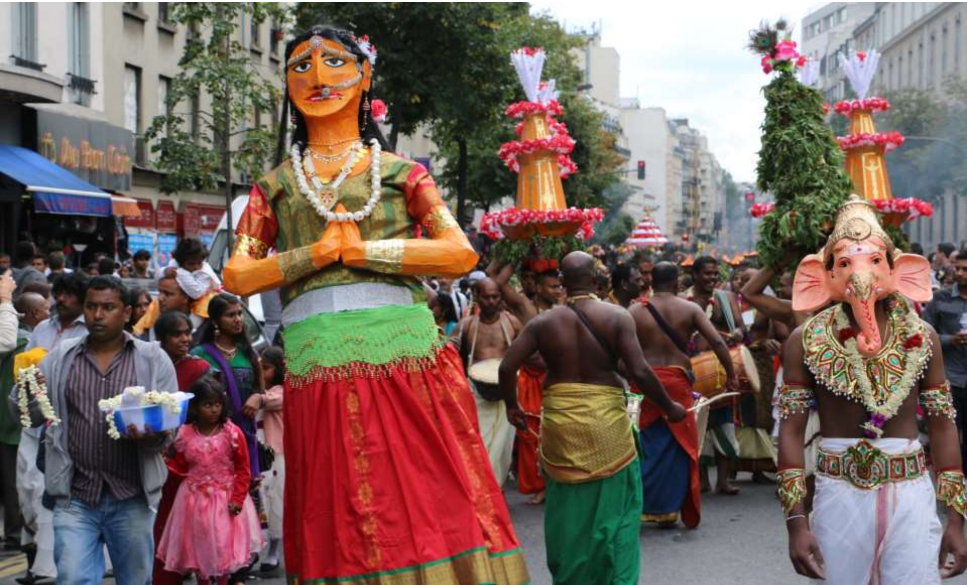
Fête de Ganesh, Paris, 2014