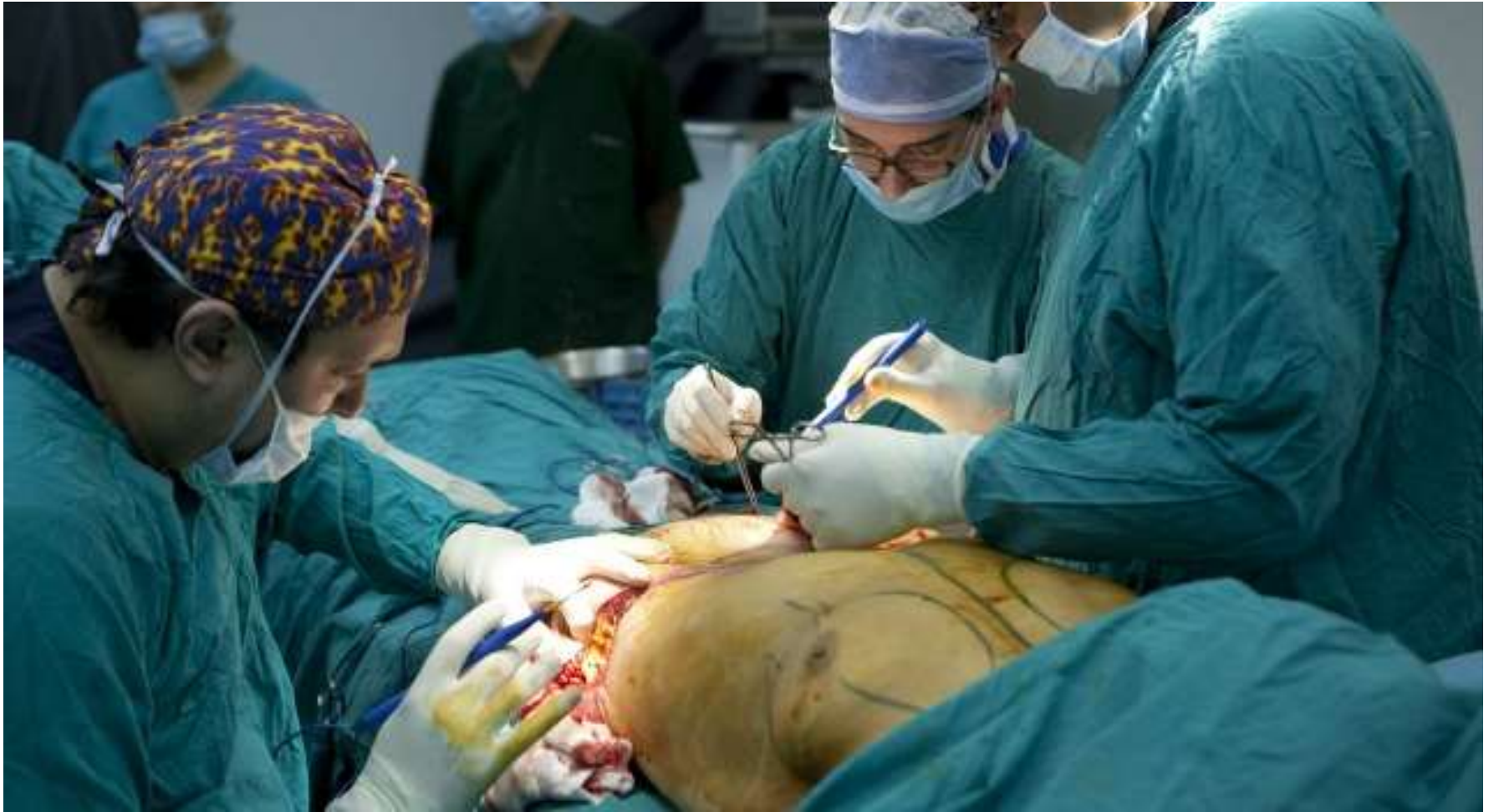
Chirurgie esthétique années 2000